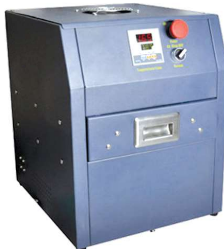
• Estándar I/0018998