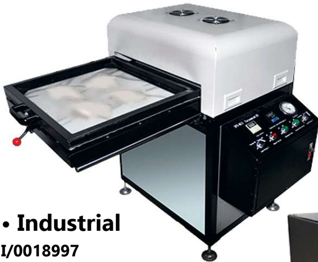
• Industrial I/0018997