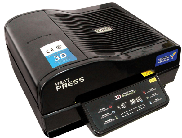
• Multifuncional I/0018969/1